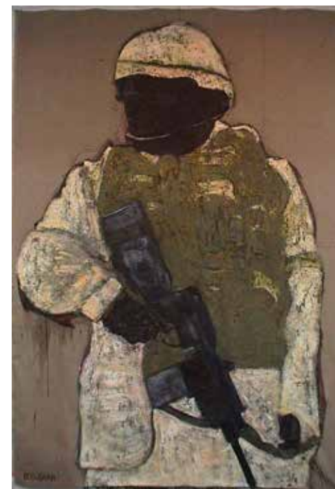
Special treatment I* (245 X 170 cm) 2006 Acrylique sur toile

*Peintures Mordantes, peintures monumentales. Auditorium Jacob Salik et Foyer Audrey et Maurice Taché de l'Espace Yitzhak Rabin. CCLJ, Bruxelles.