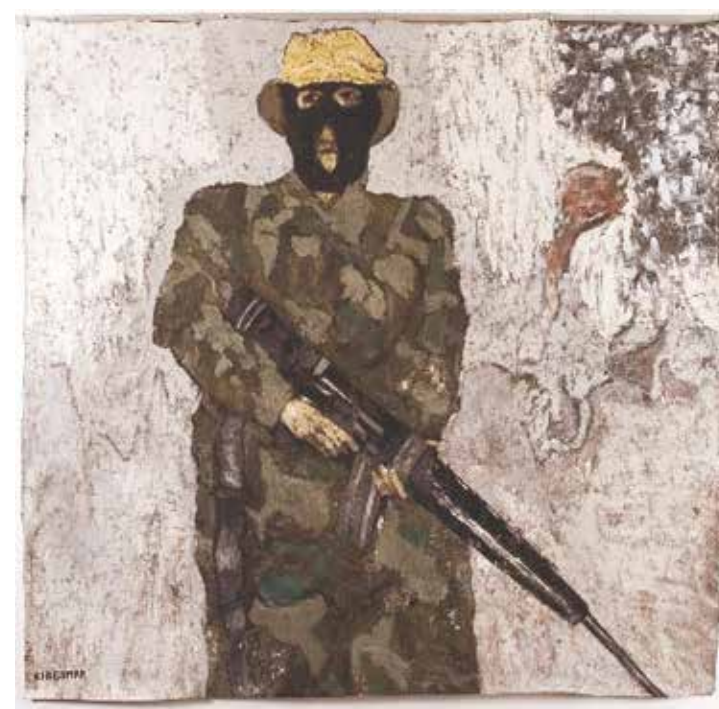
Auto portrait cagoulé* (202 X 210 cm) 2006 Acrylique sur toile

*Peintures Mordantes, peintures monumentales. Auditorium Jacob Salik et Foyer Audrey et Maurice Taché de l'Espace Yitzhak Rabin. CCLJ, Bruxelles.