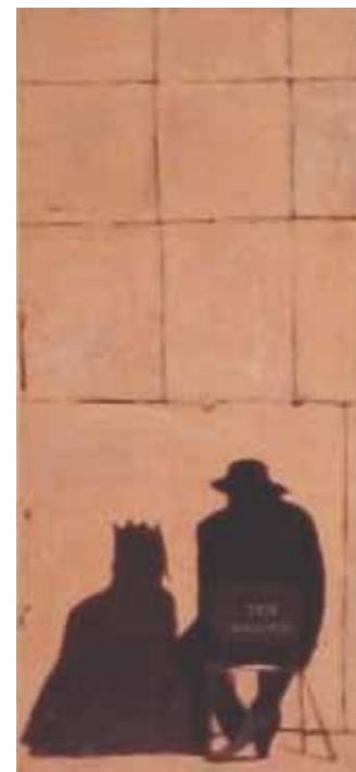
Melech* (120 x 53.33 cm) 2001 Acrylique sur papier, marouflé sur coton