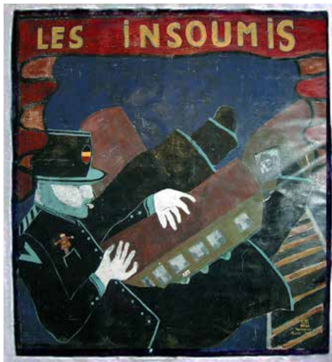
Les insoumis (210 x 200 cm) 2000 Acrylique sur toile