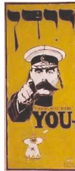
Your country needs you* (120 x 53.33 cm) 2001 Acrylique sur papier, marouflé sur coton